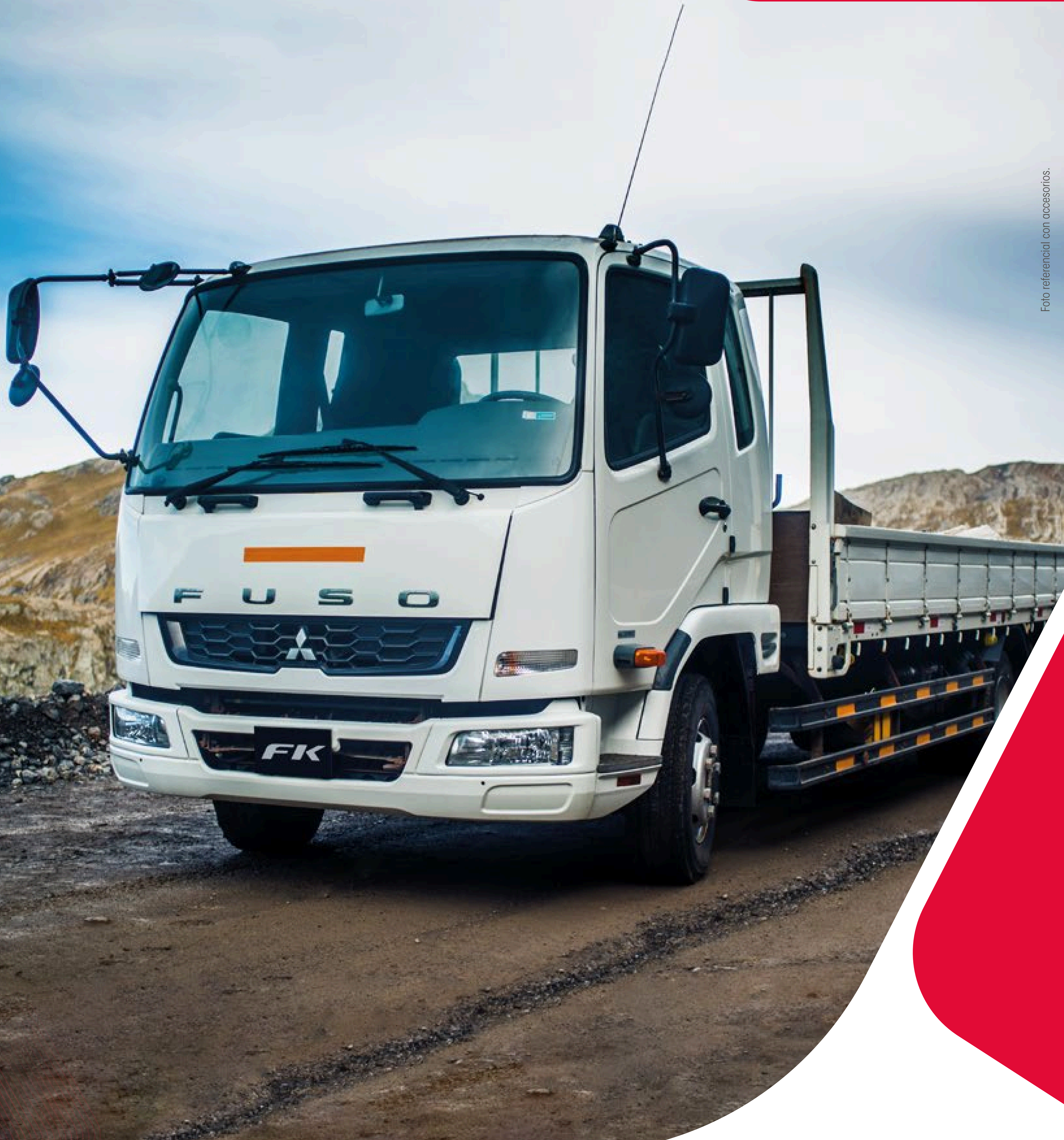
Foto referencial con accesorios.